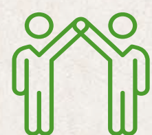
Comité de convivencia