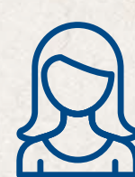
Comité de mujeres